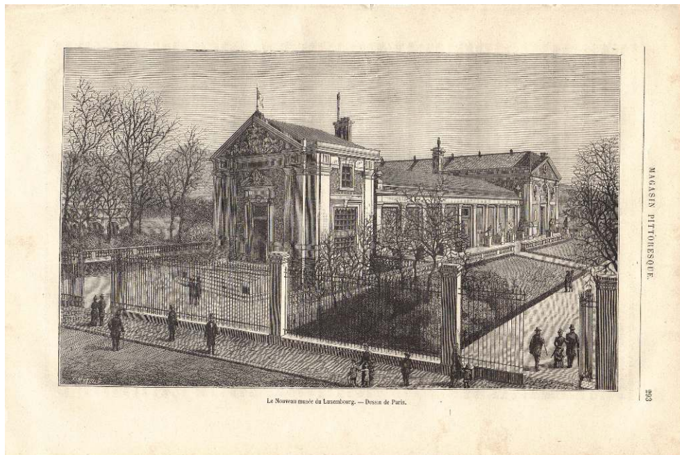
Illustration 1 : Vue cavalière du nouveau Musée du Luxembourg vers le sud-est.

Source : Paris, « Le Nouveau musée du Luxembourg », Le Magasin pittoresque , 1888, p. 293. Copyright : collection de l'auteur.